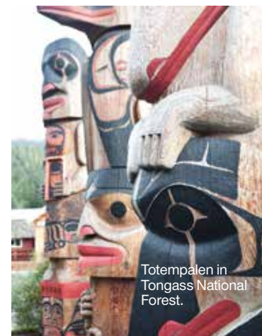
Totempalen in Tongass National Forest.

Meer dan honderd jaar oude tuinen nabij Victoria in weelderige Britse stijl. Het hele jaar geopend. 800 Benvenuto Avenue, Brentwood Bay, butchartgardens.com