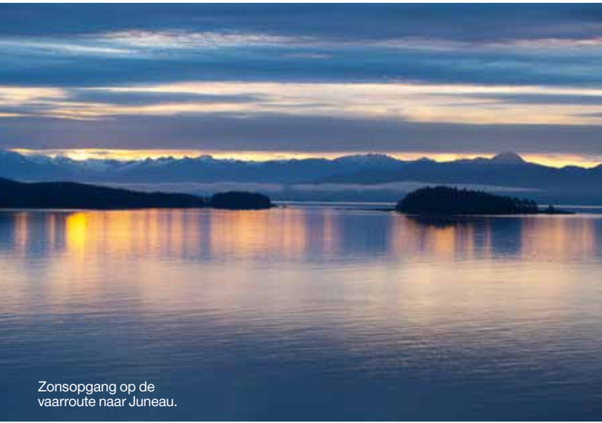
Zonsopgang op de vaarroute naar Juneau.