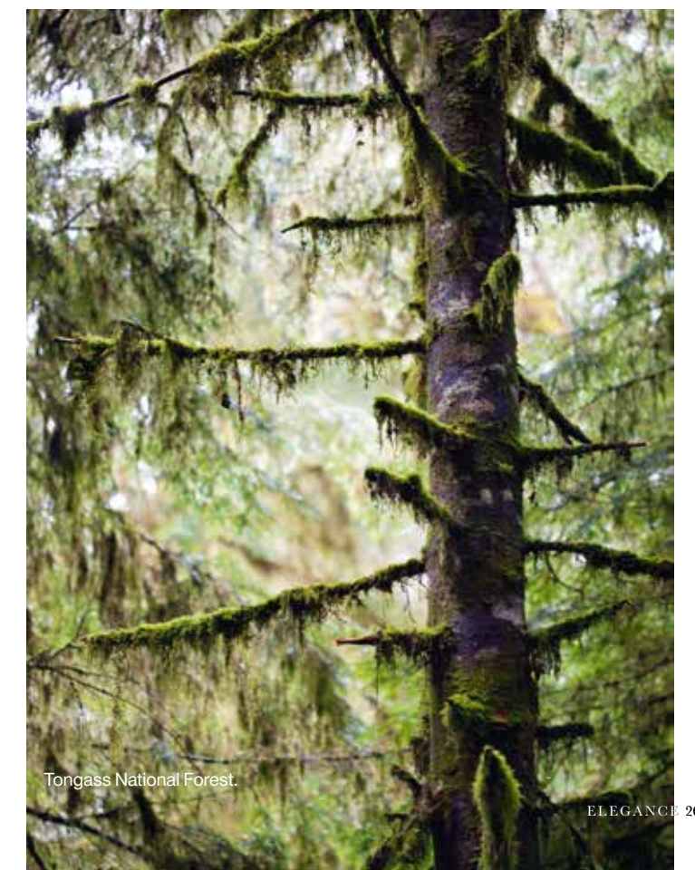
Tongass National Forest.

stad Victoria. Hét icoon van deze Canadese stad is The Empress uit 1908. Aan grandeur heeft dit klassieke hotel nog niets ingeboet, maar tegelijk blijkt het een hippe hotspot te zijn, waar een jazzband die avond voor veel sfeer zorgt. Dan is het tijd om terug aan boord te gaan en onze koffers te pakken. Vroeg in de morgen varen we de cruisehaven van Seattle binnen en komt er een einde aan dit ijselijk geweldige avontuur.