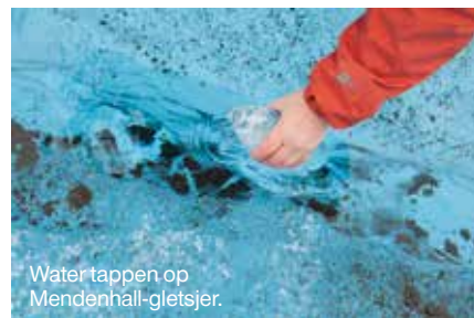
Water tappen op Mendenhall-gletsjer.