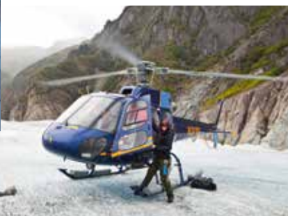
De helikopter van pilote Tracy.

De zee is onwerkelijk kalm als de zon rond een uur of zes langzaam boven de horizon rijst. Het schip glijdt over het water, terwijl de hemel achter de besneeuwde bergtoppen oranje kleurt. Het loont om zo vroeg aan dek te zijn, want bij het ochtendgloren duiken er bultrugwalvissen op! Ze spuiten fonteintjes en gooien hun staart in de lucht om